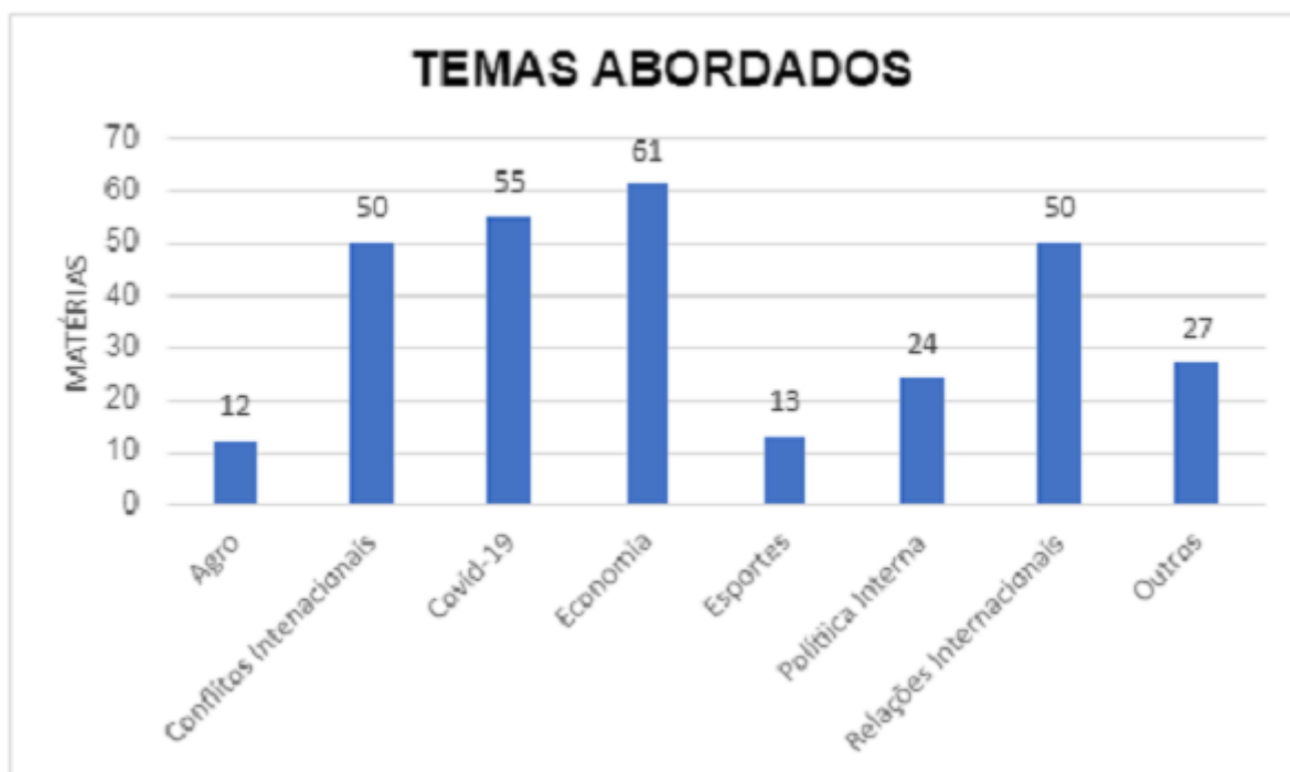
Gráfico 1: Temas Abordados

A fim de analisar quais foram os temas mais abordados, contabilizou-se os dados no gráfico 1 a seguir: