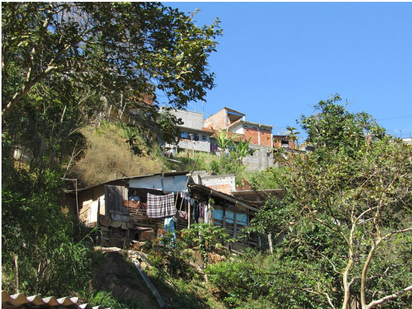
Ocupação em encosta no Bairro Fazenda Belém, Franco da Rocha, São Paulo. Classificada como área de risco muito alto (R4) segundo último mapeamento oficial do Instituto Geológico de 2006.

Uma fotografia da segregação socioespacial , as áreas de risco concentram assentamentos precários: irregularidade fundiária ou urbanística, ausência ou insuficiência de infraestrutura urbana, altos níveis de densidade dos assentamentos e das habitações, precariedade construtiva com graves problemas de habitabilidade (auto-construção), ocupação de áreas suscetíveis a inundações, deslizamentos, e população em situação de risco e exclusão social (VEYRET, 2007; CERRI, NOGUEIRA, 2012).