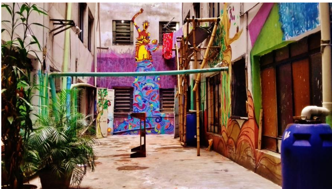
Ocupação São João - Foto do pátio interno do antigo Hotel Columbia Palace (Av. São João, 588, centro de São Paulo, capital) ocupado em 2010 pela Frente de Luta pela Moradia (FLM). Com 81 famílias e 270 pessoas (nov/2018).

A Constituição Federal brasileira conta com um capítulo dedicado ao tema das cidades e incorpora a função social da propriedade e o direito social de moradia, contando com uma lei específica, o Estatuto da Cidade (Lei 10.257/2001). Instrumentos urbanísticos, como o Imposto Predial e Territorial Urbano (IPTU) progressivo para propriedades ociosas, a demarcação de Zonas de Interesse Social (ZEIS), a outorga onerosa do direito de construir, são um avanço dentro do movimento da reforma urbana e regularização fundiária, mas não têm alcançado resultados expressivos para cumprir o direito à moradia e à cidade. As ocupações em áreas de risco seguem aumentando, tanto nas periferias dos centros urbanos, em terrenos de encostas ou de várzea susceptíveis a deslizamentos e inundações, respectivamente, quanto em terrenos e edifícios no centro que passaram por processo de esvaziamento e se transformaram em vazios urbanos 1 .