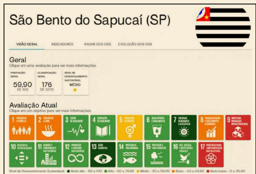
Figura 1 - Visão geral de São Bento do Sapucaí no IDSC-BR

A experiência de São Bento do Sapucaí, um pequeno município turístico do estado de São Paulo, com 11.674 habitantes, ilustra como a inovação em políticas públicas pode ocorrer a partir do uso estratégico de dados no processo decisório. No âmbito do projeto Governança de Políticas Públicas para Sustentabilidade (GPPS), foi apresentado aos secretários municipais o desempenho dos ODS através da plataforma IDSC-BR, juntamente com um diagnóstico socioeconômico e ambiental. Este documento foi citado no Plano Plurianual (PPA) do município, demonstrando a incorporação na gestão municipal da apresentação realizada e dos resultados encontrados, dada a necessidade contínua de dados